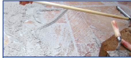
Ausfugen mit drainfähigem Epoxidharz-Fugmaterial

Flecken durch aufsteigende Feuchtigkeit können durch „Rundum-Imprägnierung“ vor dem Verlegen reduziert werden. Voraussetzung für dieses Verfahren ist, dass die Steinplatten trocken und sauber sind und in Splitt verlegt werden. Das allseitige Auftragen auf die Platte erfolgt durch Tauchen (ca. 30 Sekunden) oder Einstreichen mit einem Pinsel oder Einsprühen. Vom Material nicht aufgenommenes Produkt muss vor dem Trocknen abgewischt werden. Vor dem Verlegen oberflächlich abtrocknen lassen, da bei Verlegung im nassen Zustand ein Wirkungsverlust eintreten kann.