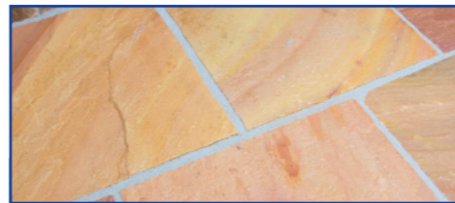
Die frisch verfugte Fläche wird zeitsparend gereinigt – sie zeigt sich klar und sauber.

Der für drainfähige Fugmaterialien typische z.T. ungleichmäßige Glanzfilm tritt meist gar nicht mehr, beziehungsweise nur noch in geringem Maße auf. Die Steinoberfläche behält ihren natürlichen Charakter. Ein sich ablösender Epoxidharzschleier und die damit einhergehende Weißverfärbung wird so gut wie nicht mehr beobachtet.