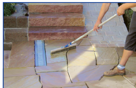
Lithofin FLECKSTOP >W< gleichmäßig verteilen

Die frisch imprägnierte Fläche bis zum oberflächlichen Abtrocknen (ca. 1-2 Stunden) vor Regen und Feuchtigkeit schützen. Arbeitsgeräte reinigen Sie mit Wasser.